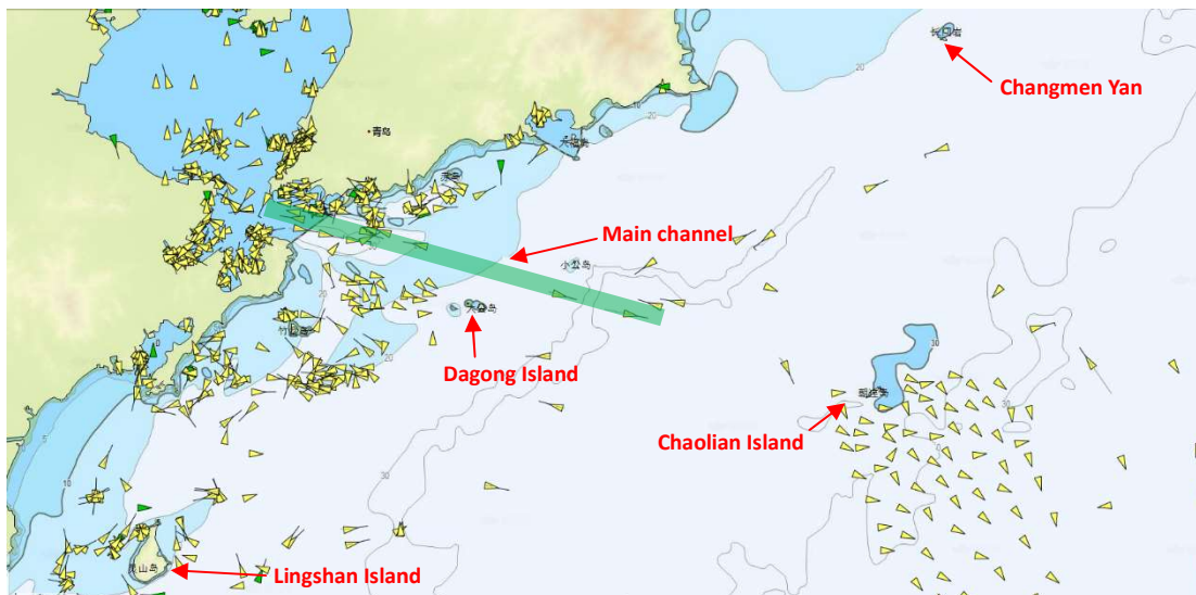
An illustration of key navigable waters