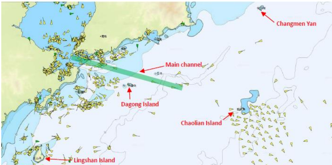
主な航行可能な水域