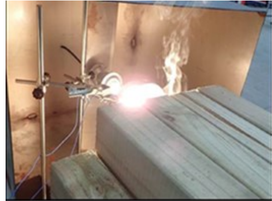
図 2 ランプによる木材加熱実験

当該条件で加熱試験を実施したところ、温度上昇から約 40 秒後に、ランプ表面 155°C、木材表面 114°Cの時に、木材から発煙が認められた。