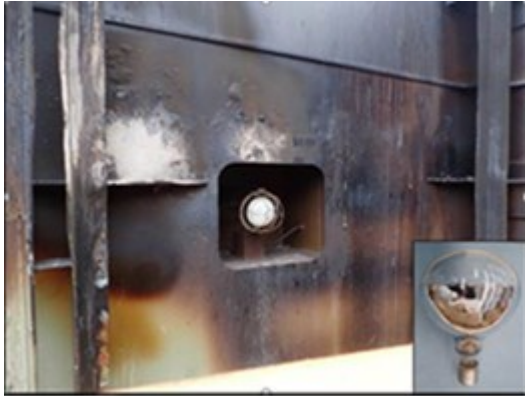
図 1 カーゴランプ埋込み口

カーゴランプとして、図 1 に示す埋込み口（リセス）に白熱ランプが取り付けられていた。荷崩れ軽減の目的で材木はホルド内に隙間なく積付けられていて、ランプ表面から材木までの距離は 50mm 程度であった。