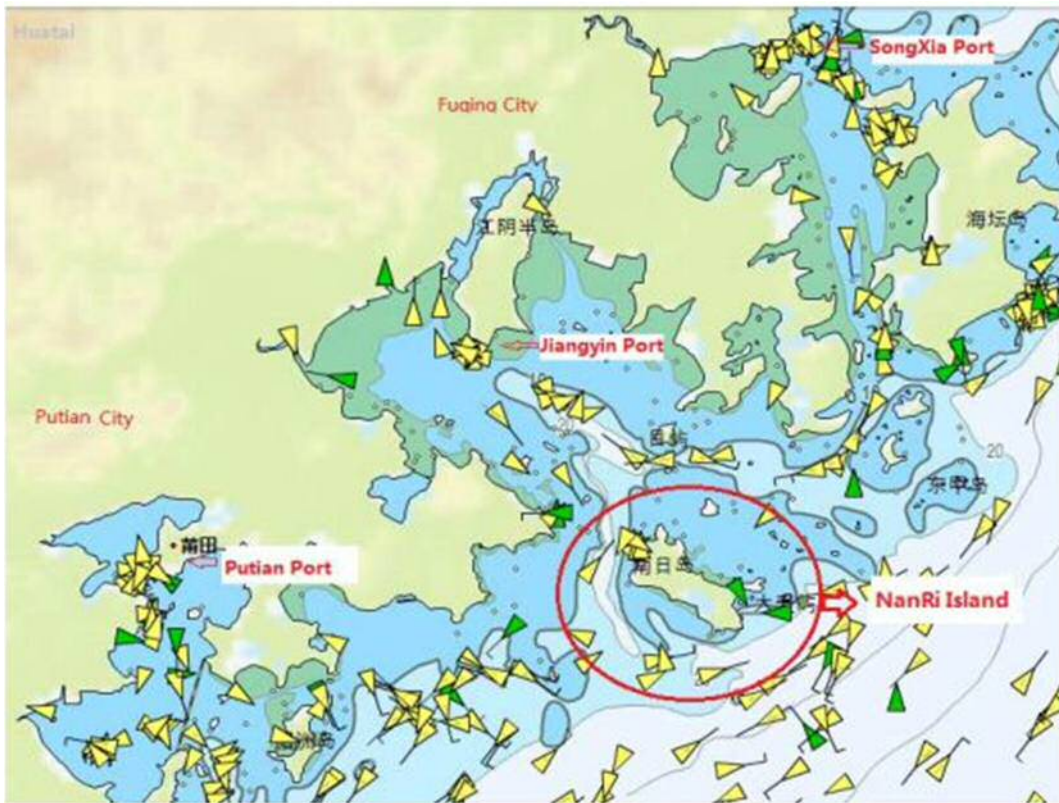
NanRi Island の位置